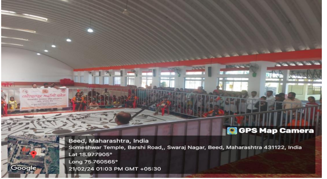
शिवकालीन शस्त्र प्रदर्शन भेट प्रसंगीचे छायाचित्र