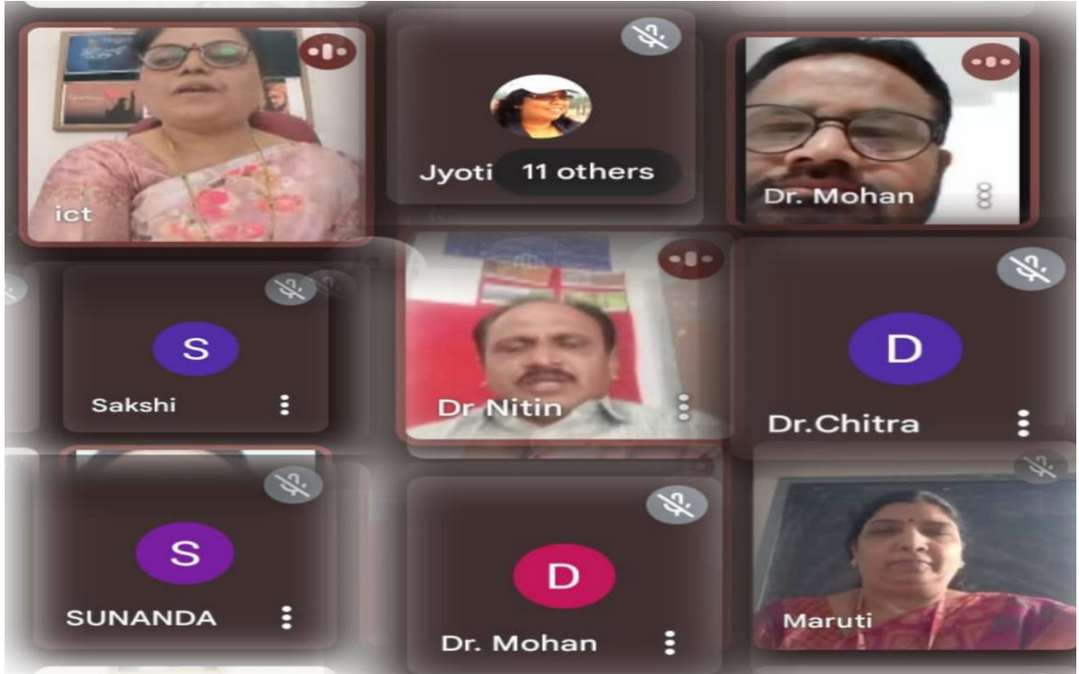
शिवजयंती निमित्त आयोजित ऑनलाईन राज्यस्तरीय वेबीनार प्रसंगीचे छायाचित्र